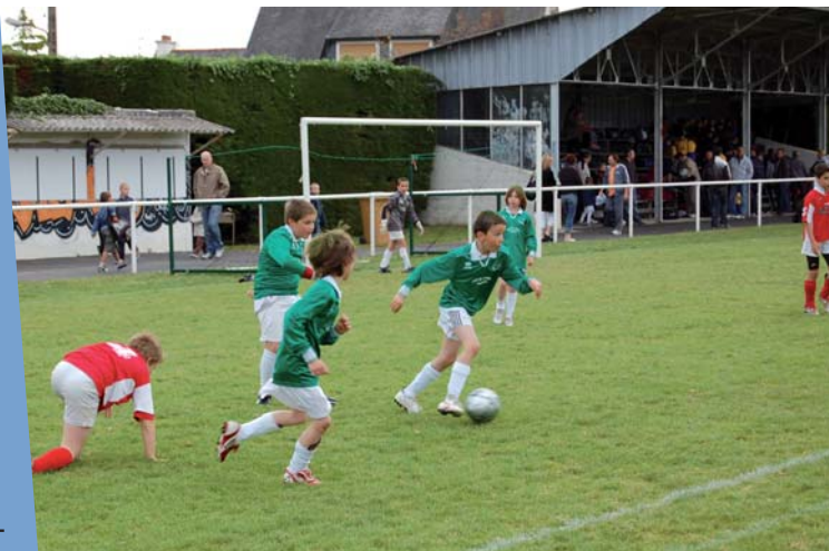
800 jeunes footballeurs dimanche 18 mai sur les terrains de Langueux : du beau spectacle !